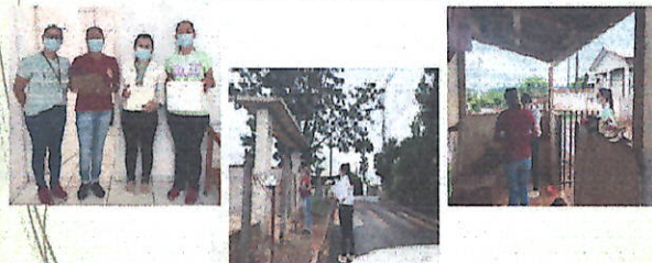
Ação em parceria com a ESF Jardim Iguaçu na busca do Sintomático Respiratório em alusão ao Dia mundial do Combate a Tuberculose (23/03/2022)