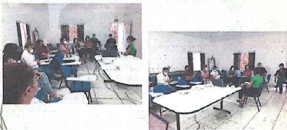
Reunião Comitê de Prevenção da Mortalidade Materno Infantil e Fetal (09/03/2022)