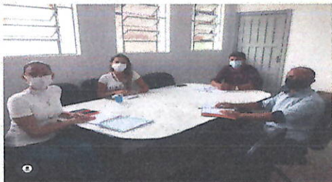
Reunião referente as ações de prevenção ao COVID-19 na UFFS