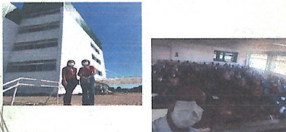
Reunião UFFS - Fala com os trabalhadores sobre COVID-19